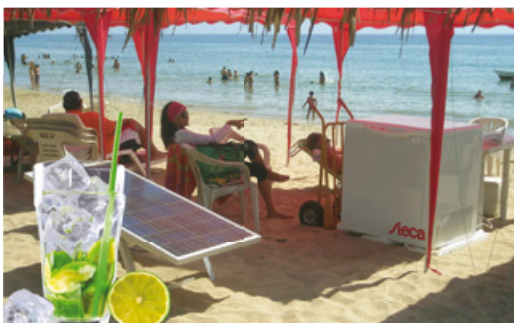
Gekühlte Getränke, Karibik