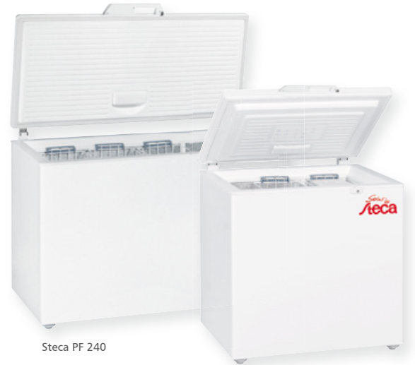
Steca PF 240

Nutzerfreundlichkeit durch ein großzügiges digitales Display mit Einstellmöglichkeiten, höchster Qualitäts- und Zuverlässigkeitsstandard und eine lange Lebensdauer zeichnen diese Produkte aus. Die Truhen sind leicht zu reinigen, da sie einen Verschlussstopfen am Boden zum Wasserauslauf haben.